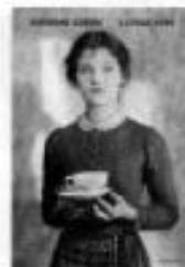
Raymond Guérin, La Finitude, Finitude, 1977

Eugène Criqui aurait pu être aussi un personnage de Raymond Guérin (1905-1955). Guérin demeure, malgré des rééditions régulières et une biographie de Jean-Paul Kauffmann, un écrivain sous-estimé, sans doute parce que, comme son ami Henri Calet, il a été coincé entre les sartrien, le Nouveau Roman et les Hussards qui chassaient en meute. Guérin, qui a connu la captivité en 1940, a perdu en route toutes ses illusions sur les hommes. Un exemple de son pessimisme rageur, on le trouve dans La Peau dure , roman paru en 1948 et tout juste réédité par les éditions Finitude. La Peau dure , c'est l'histoire de trois sœurs qui vont prendre tour à tour la parole dans la France de la Libération.