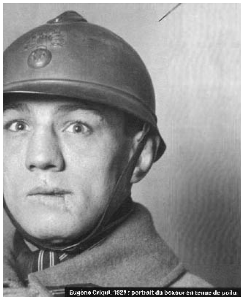
Eugène Criqui, 1927 : portrait du boxeur en tenue de poilu

Attitude d'une fermette normande, mourant oublié de tous en 1977.