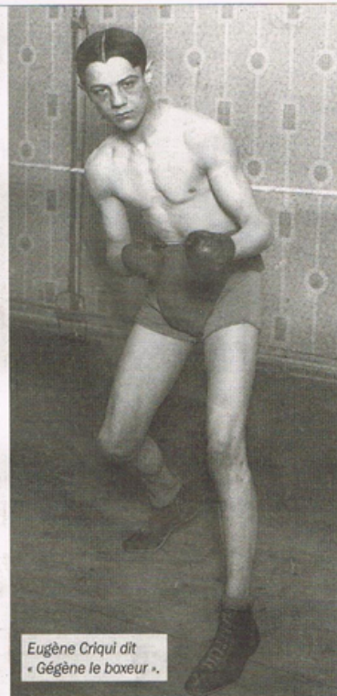
Eugène Criqui dit « Gégène le boxeur ».