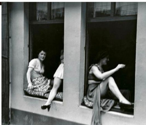
Prostituées à la fenêtre d'un bordel de Hambourg (Allemagne), en 1929.